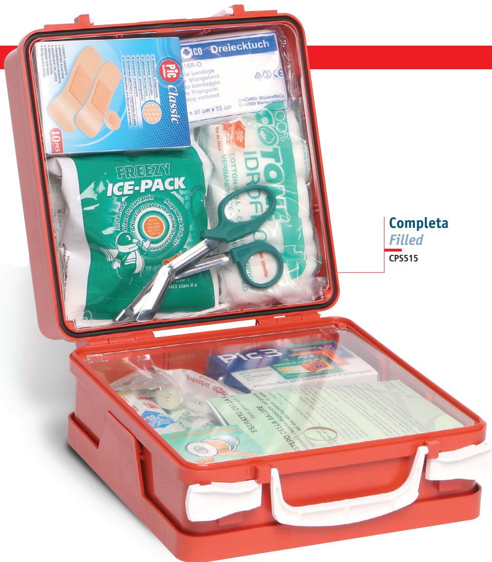
Completa Filled CPS515