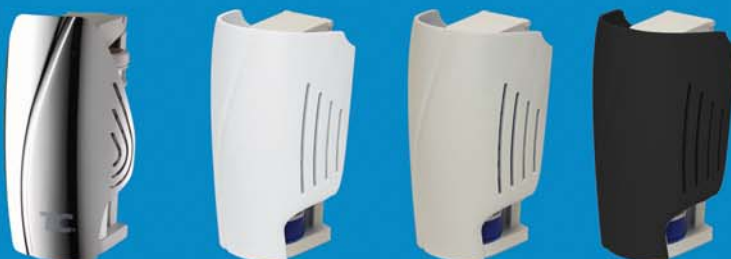
Chromato, Bianco, Grigo e Nero distributore

La cella di carburante genera dell'idrogeno all'interno della camera della fragranza. Mentre l'idrogeno viene generato forza (spinge) una pari quantità di volume di fragranza dalla camera. Il flusso dell'aria naturale nel gabinetto distribuisce la fragranza per tutta la stanza.