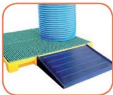
Rampa di salita per piattaforma